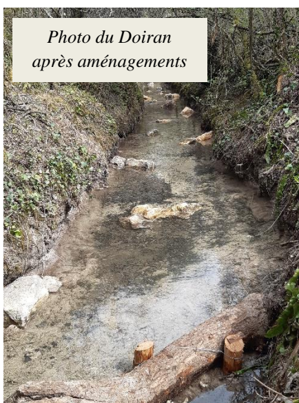
Photo du Doiran après aménagements

Après réouverture, les techniciens du Syndicat ont mis en avant la nécessité de réaliser des aménagements pour resserrer le lit mineur surdimensionné et obtenir un chenal principal d'écoulement adapté.