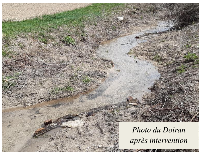
Photo du Doiran après intervention

Ces aménagements ont été complétés par la mise en place de blocs, épis ... dans le lit mineur, afin de diversifier les habitats.