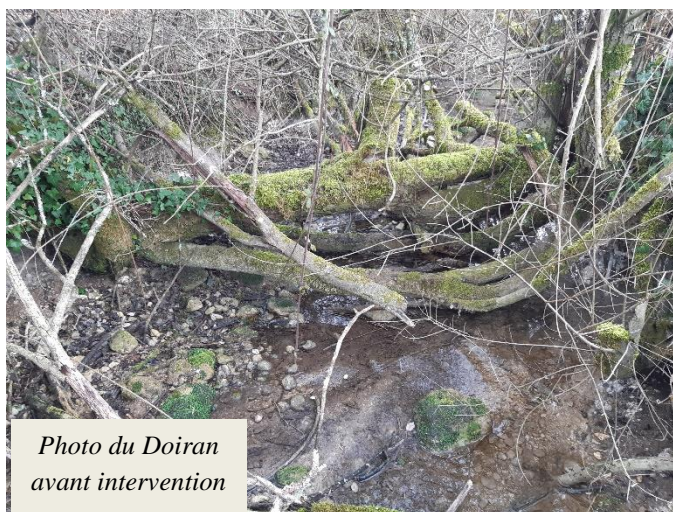
Photo du Doiran avant intervention