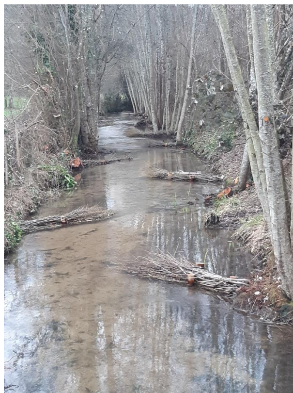
Le Puymartin après intervention