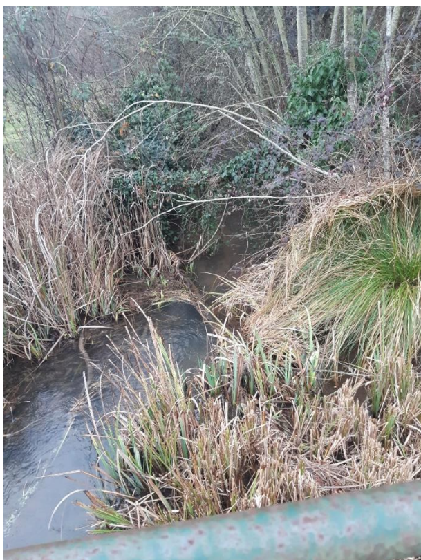
Le Puymartin avant intervention

L'équipe régie a complété l'intervention, par la mise en place d'aménagements (épis déflecteurs et seuils). L'objectif a été de resserrer le gabarit du lit afin de favoriser un écoulement principal non rectiligne, facilitant également un auto curage naturel et proposant une diversité des habitats.